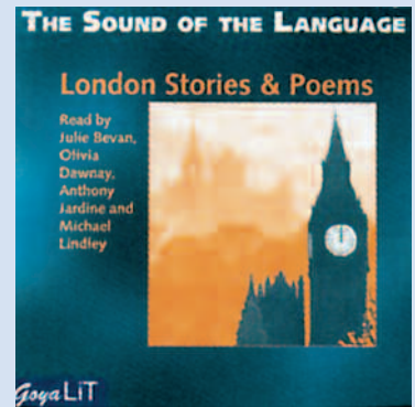
Versch. Autoren und englische Sprecher, GoyaLit 2006. 12,95 €, 77 Min., ab 16 Jahren, mindestens 6 Jahre EU, CD

Im Mittelpunkt dieser anspruchsvollen CD steht die Stadt London. Literaten wie William Blake, Oscar Wilde oder Arthur Conan Doyle haben über sie Geschichten oder Gedichte verfasst. Diese werden von Native Speakers vorgetragen und eignen sich hervorragend z.B. für den Einsatz im Landeskundeunterricht der Oberstufe. Ein beiliegendes Büchlein verzeichnet die wichtigsten, unbekanntesten Wörter und nimmt somit den Zuhörern viel Arbeit ab, denn anspruchsvoll sind die Geschichten und Gedichte allemal.